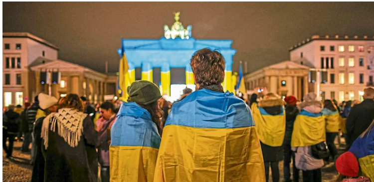
Eine proukrainische Demo in Berlin

Stand: 14.03.2026 | Lesedauer: 4 Minuten